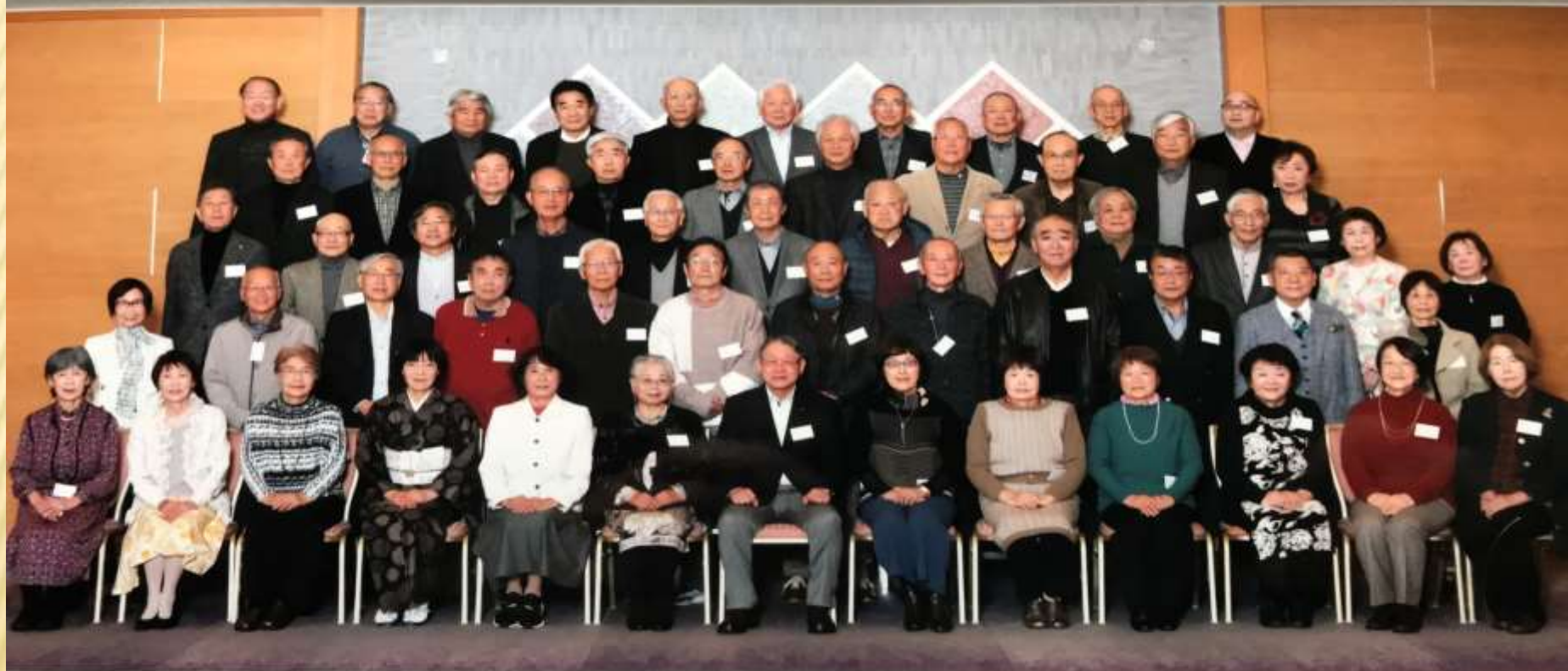
天城高校第20回卒業同窓会 2024年1月6日 於 倉敷国際ホテル