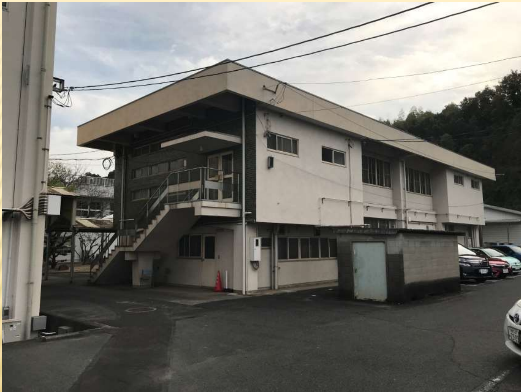
鉄軒会館 創立60周年記念 昭和41年