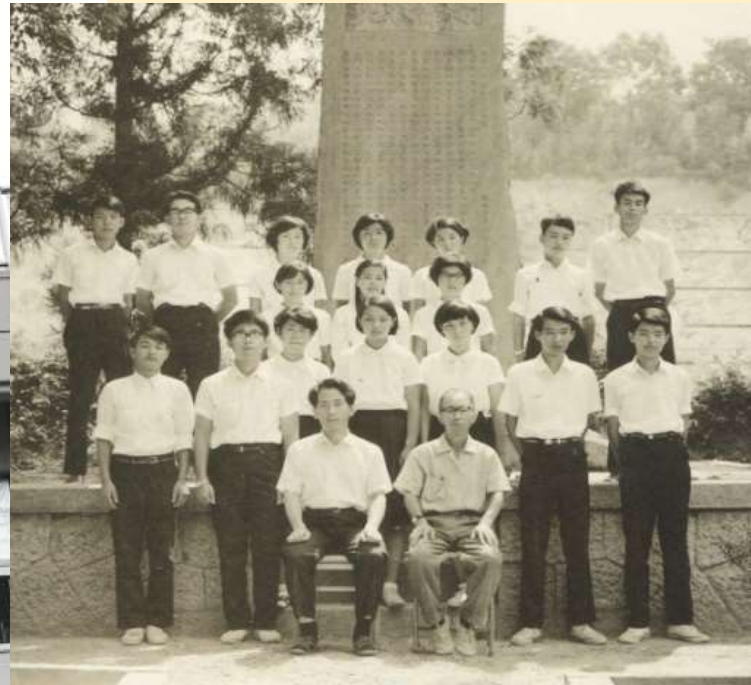
鉄軒碑 大正9年(1920年) 建立 犬養毅撰文