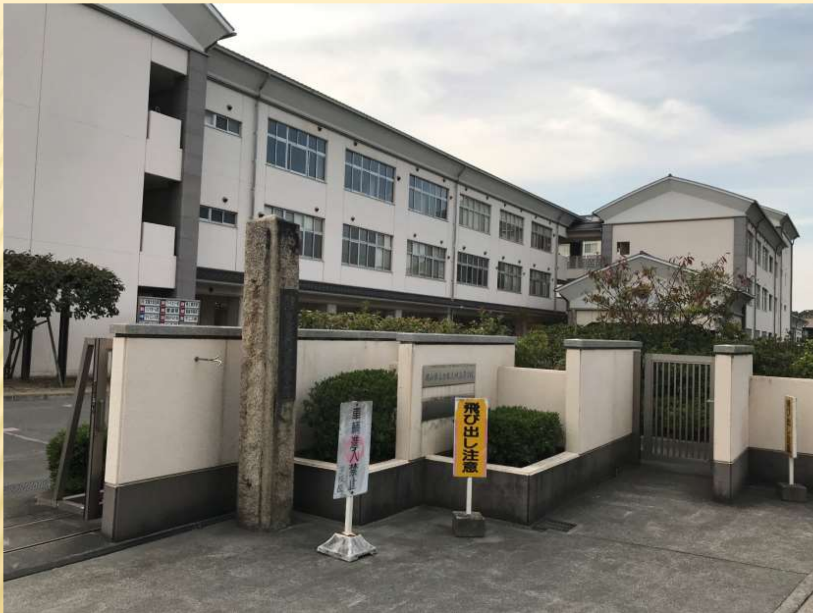
校門の石碑は北側の校門に移動しています